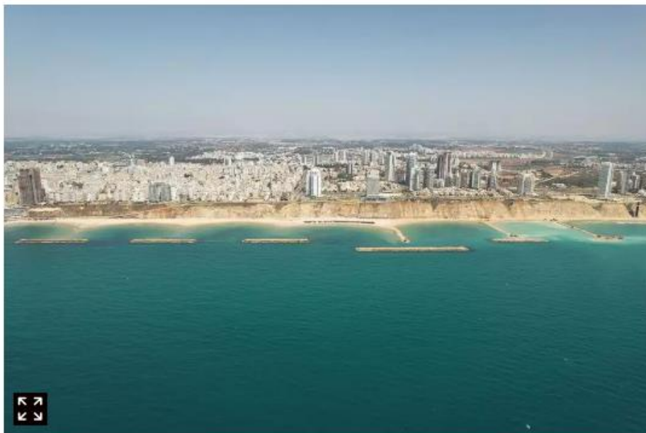
פרויקט שוברי הגלים בתנ"ה.

https://www.israelhayom.co.il/news/environment/article/15889136