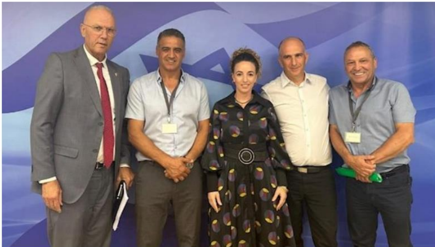
מחוף לשיבת הממשלה (צילום ללא)